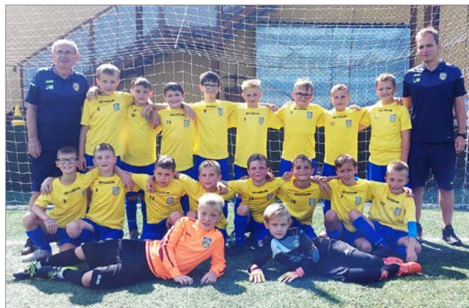
Družstvo starší přípravy MFK Nového Města nad Metují.

Potenciál mužstva je obrovský. Máme hodně šikovných kluků, o které se již teď zajímají kluby v širokém okolí. Kluci si perfektně rozumí, a to na hřišti i mimo něj. Je to výborná parta, která má navíc velkou podporu rodičů.