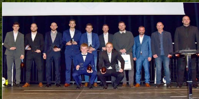
XI. Deníku sezony 2021/2022.