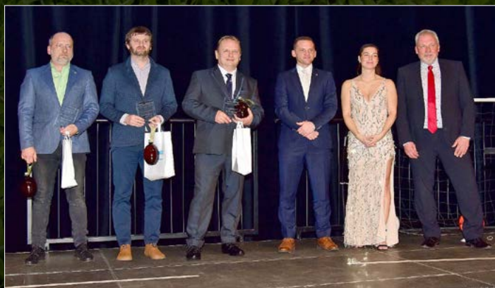
Trenér kategorie mužů.