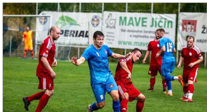
Fotbalistům Železnice (v modrém) se po postupu daří i v 1. A třídě.