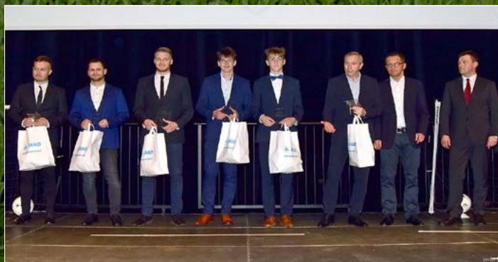
Bombeři sezony 2021/2022.