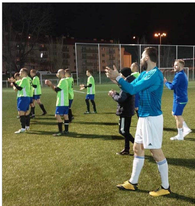
Po vítězném utkání se Stěžery v jarní části AM Gno1 1. A třídy.