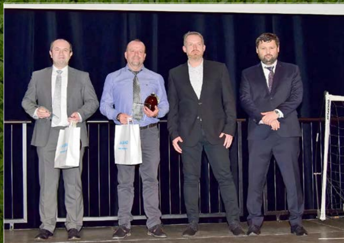
Rozhodčí soutěží KFS.