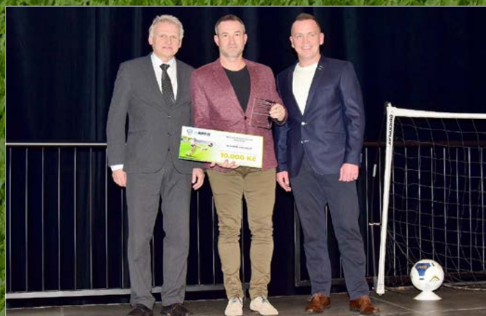
Nejhezčí fotbalový trávník.