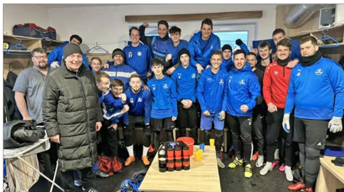
Kostelec nad Orlicí povede v jarní části sezony trenér s prvoligovými zkušenostmi.