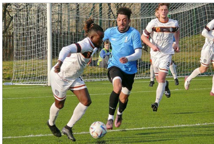
Solnice na úvod jarní části porazila Polici nad Metují 2:0.