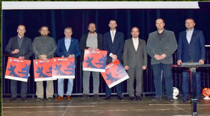
Trenér kategorie mládež.